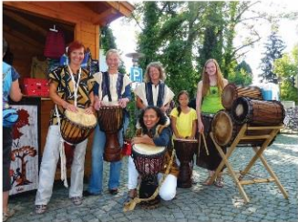
Die afrikanische Trommelgruppe „Jankadi“ ist wenn möglich immer bei unseren Aktionen dabei

Alle Mitglieder arbeiten ehrenamtlich. Jede Spende kommt zu 100 % den Vereinszwecken zugute!