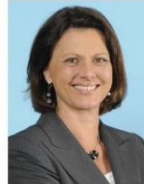
Bundesministerin für Ernährung, Landwirtschaft und Verbraucherschutz

" Die Unterstützung der Berufsbildung von Jugendlichen in Burkina Faso ist eine wichtige Investition in die Zukunft des Landes. Nur mit einer guten Ausbildung können Jugendliche eine wirtschaftliche Grundlage und somit Zukunftsperspektive für ihr eigenes Leben entwickeln und gleichzeitig zum Aufbau ihres Landes beitragen. Gerade in Subsahara-Afrika stellt die Verbesserung der Berufsbildung von Jugendlichen eine unabdingbare Voraussetzung dar, um die Millenniumsentwicklungsziele zu erreichen. Deshalb begrüße ich das Engagement des Vereins "FANGA e.V." und wünsche ihm viel Erfolg bei seiner so wichtigen Arbeit in Burkina Faso. "