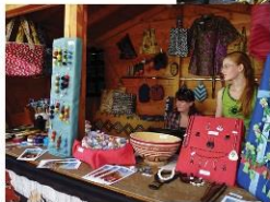
Verkaufstand mit Waren aus Burkina Faso auf dem Bürgerfest in Bruckmühl