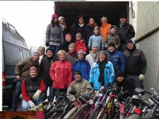
FANGA e.V. Mitglieder und Pateneltern beim Beladen eines LKW mit Sachspenden für das Ausbildungszentrum